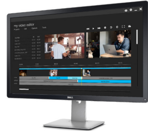
采用 PremierColor 技术的 Dell UltraSharp 超高清 4K 显示器 | UP3216Q